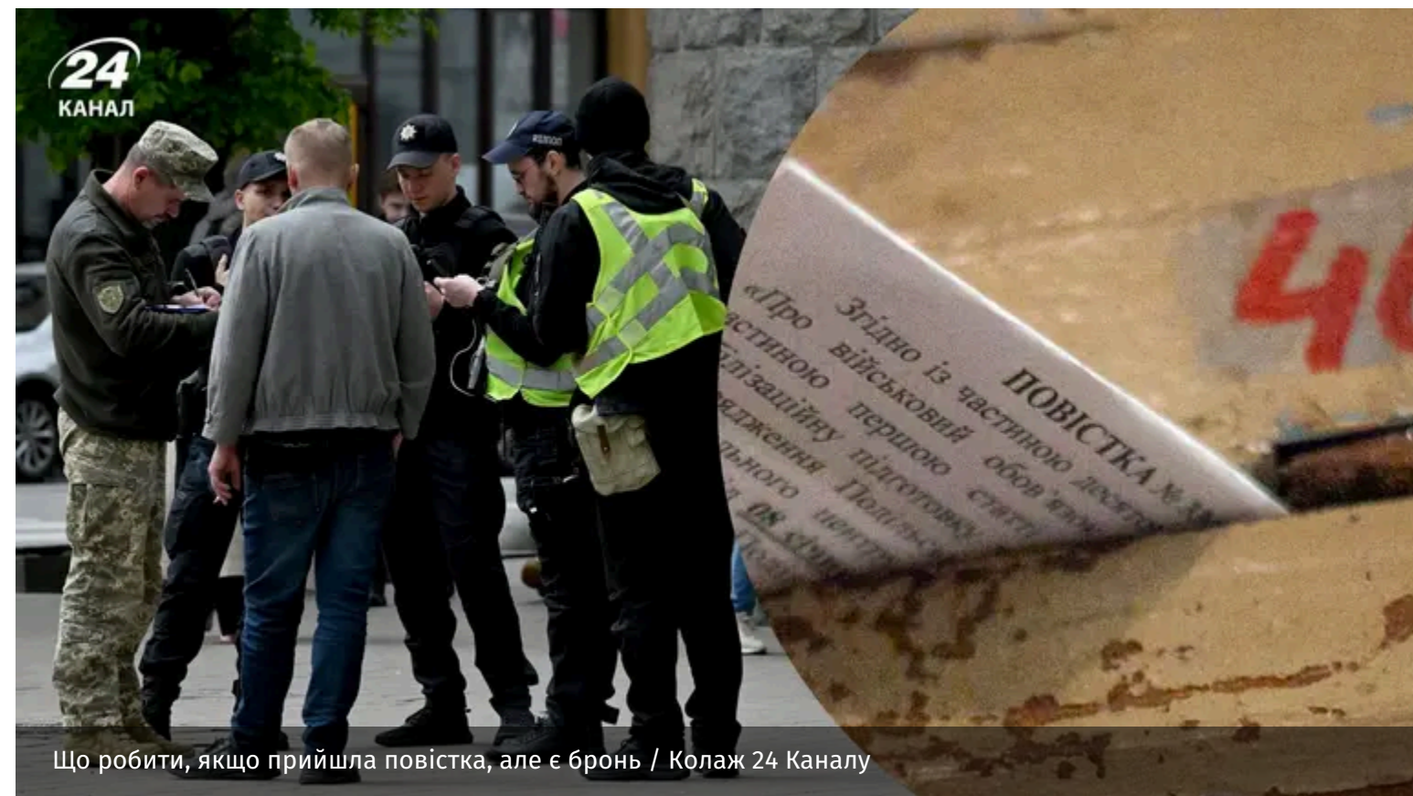
Що робити, якщо прийшла повістка, але є бронь

В Україні продовжують діяти воєнний стан і загальна мобілізація, дію яких подовжено до 2 серпня 2026 року. У межах цих заходів призову підлягають військовозобов'язані чоловіки віком від 25 до 60 років, за винятком тих, хто має оформлене бронювання або законну відстрочку.