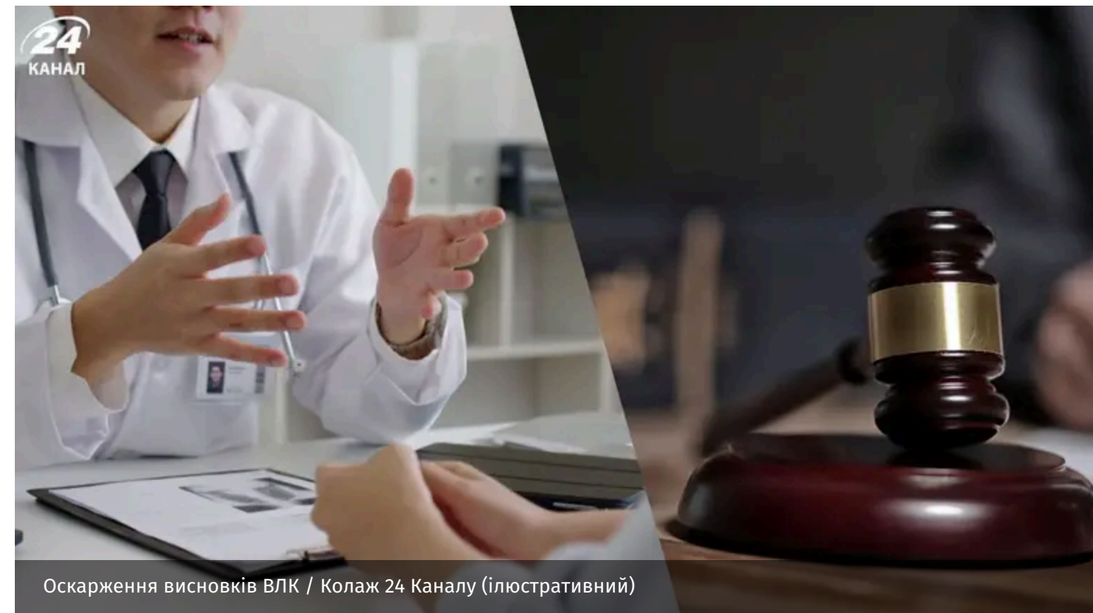
Оскарження висновків ВЛК / Колаж 24 Каналу (ілюстративний)

Військовозобов'язані після проходження військово-лікарської комісії можуть не погодитись з її висновком. У такому випадку особа може його оскаржити.