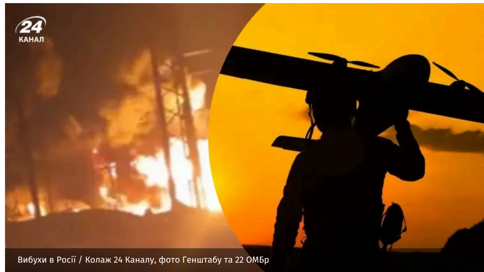
Вибухи в Росії

4 червня та в ніч на 5 червня підрозділи Сил оборони України вдарили по низці об'єктів ворога. Було уражено пункти управління та особовий склад.