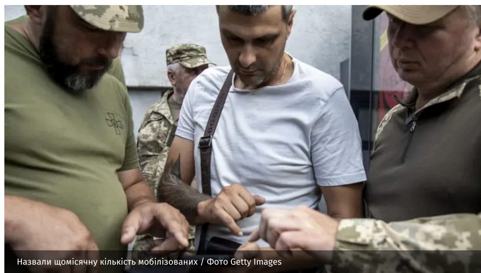
Назвали щомісячну кількість мобілізованих

Щомісячно мобілізаційні заходи в Україні залучають до лав Збройних сил близько 30 тисяч військовозобов'язаних. Саме від цієї цифри варто відштовхуватися, оцінюючи масштаби роботи ТЦК та кількість конфліктів навколо мобілізації.