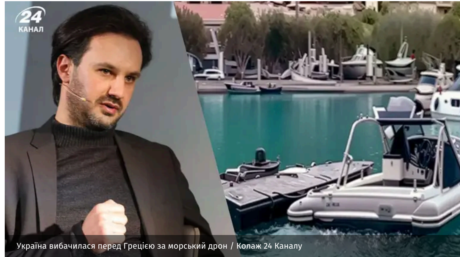
Україна вибачилася перед Грецією за морський дрон

Після інциденту з морським дроном, який виявили у травні в Іонічному морі поблизу грецького острова Лефкада, українська сторона висловила вибачення країні. Київ підкреслює важливість дружніх відносин із Грецією.