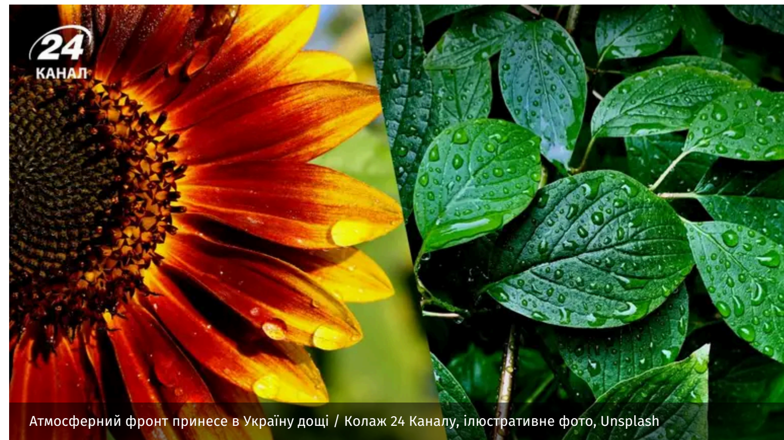
Атмосферний фронт принесе в Україну дощі

Перший тиждень літа в Україні завершиться теплою погодою з комфортними температурами, проте атмосферний фронт із заходу принесе дощі та грози, які поступово охоплять значну частину території країни.