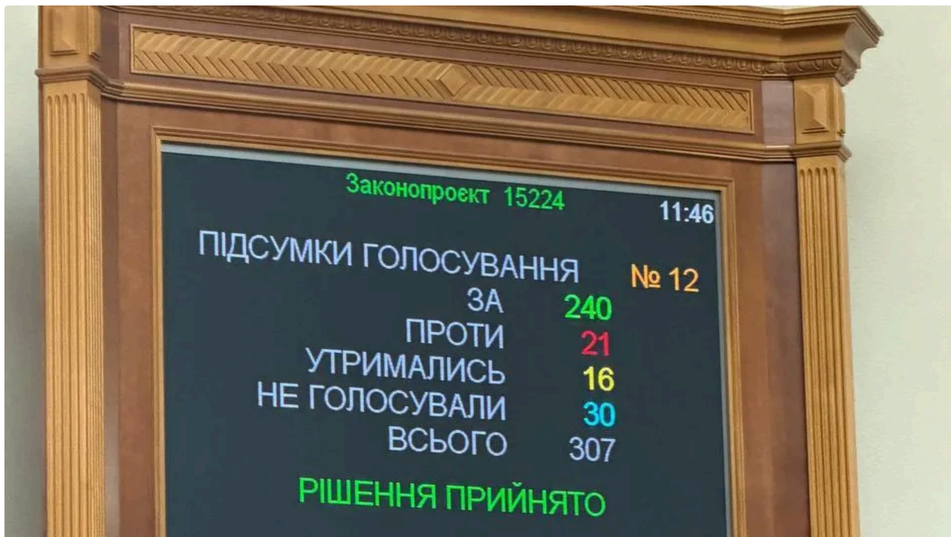
Парламент зробив перший крок до збільшення фінансування оборони на 1,56 трлн грн

28 травня, 12.50 🔊 Этот материал также можно прочитать на русском