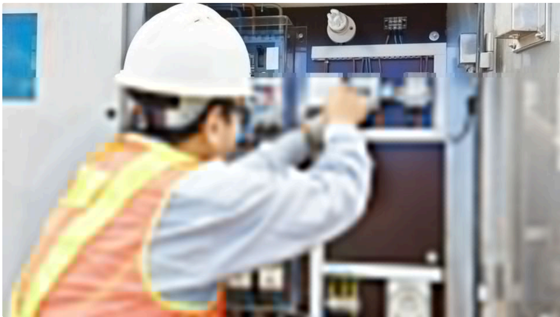
Інтеграція ринку з європейським суттєво обмежить роль price cap в Україні, заявив Кудрицький

30 травня, 22:56 🗨️ Этот материал также можно прочитать на русском