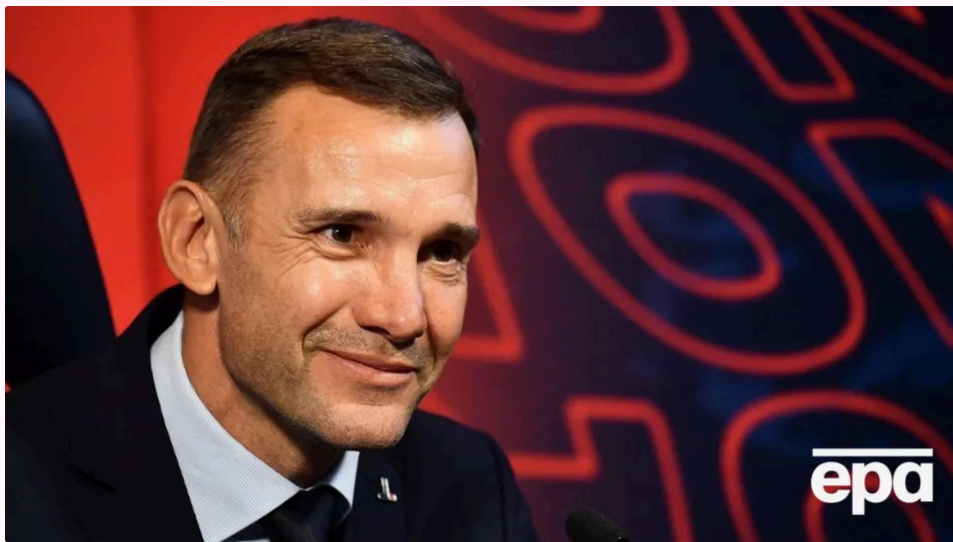
Шевченко 2024 року повернувся в Україну

27 травня, 20:15 🗨️ Цей матеріал також можна прочитати на руском