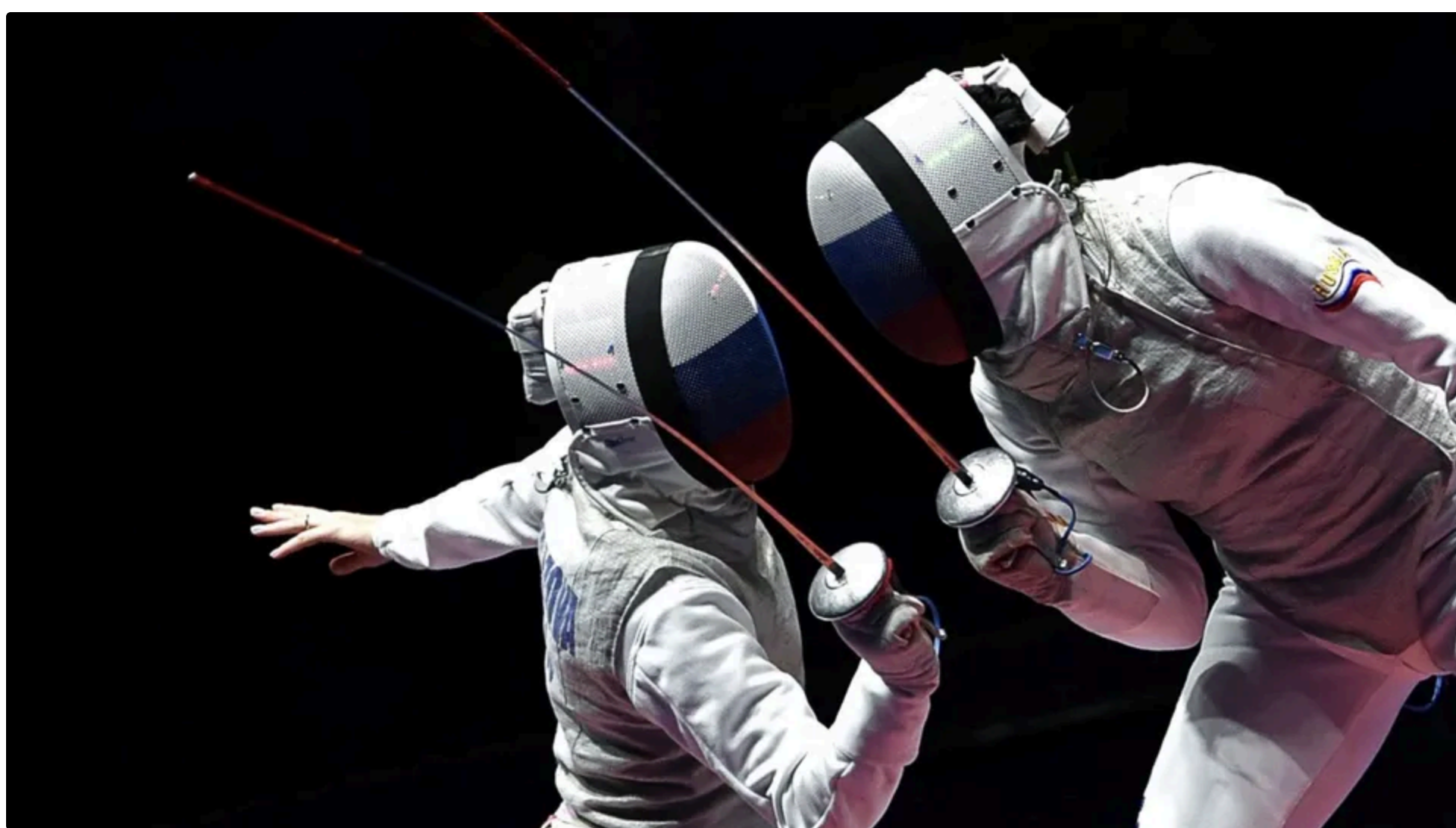
Фехтувальники з РФ і Білорусі виступали в "нейтральному" статусі із 2023 року

3 червня, 12.17 🔗 Цей матеріал також можна прочитати на руськом