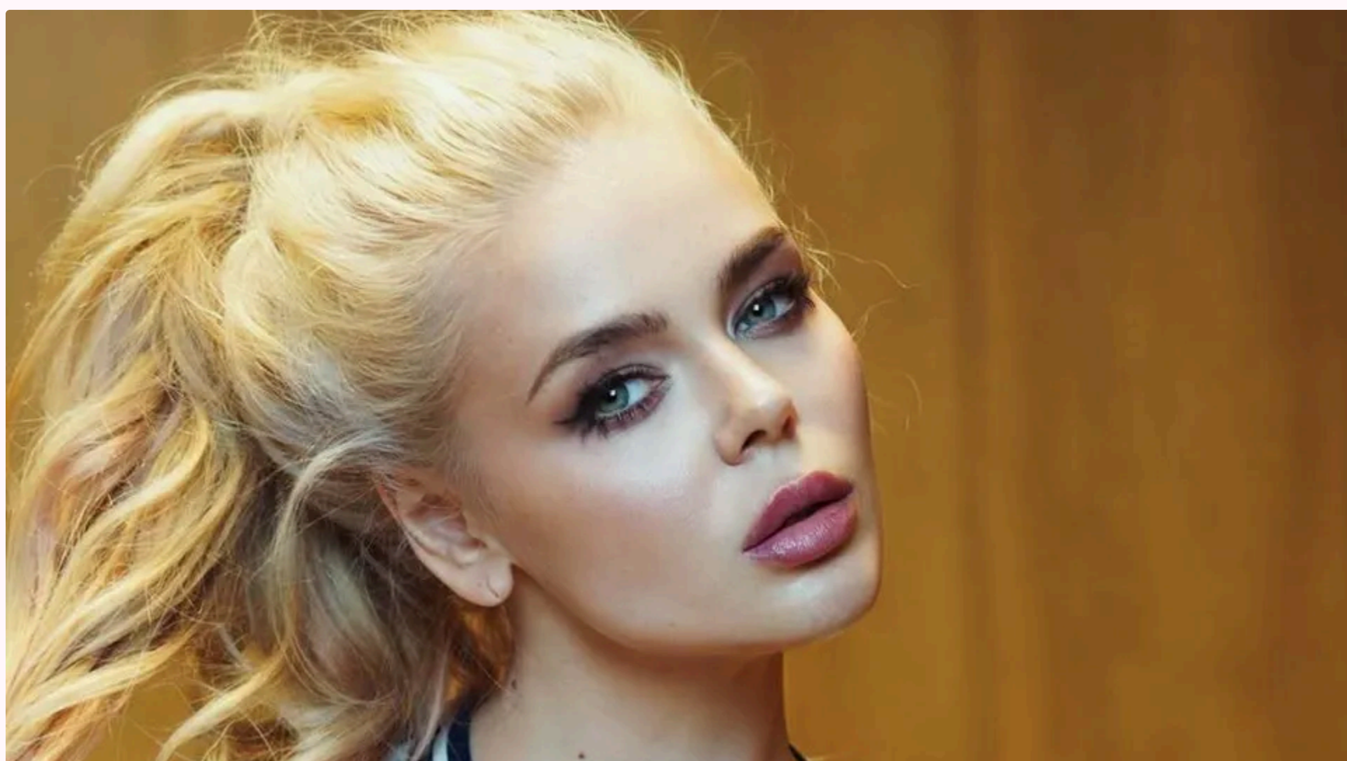
Гросу не відкриває всіх аспектів свого життя

3 червня, 12.50 📢 Этот материал также можно прочитать на русском