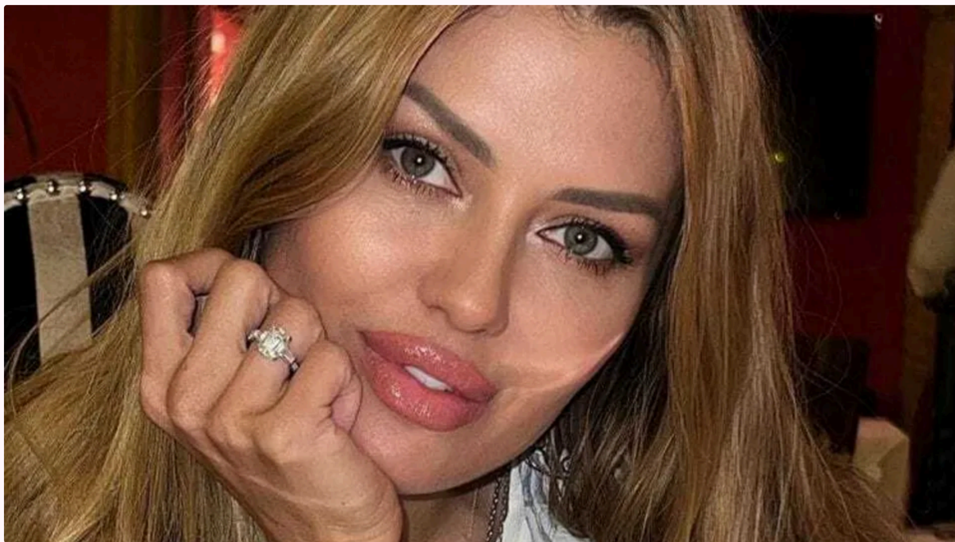
Боня: Ніби мене немає!

3 червня, 13.24 🗨️ Цей матеріал також можна прочитати на руському