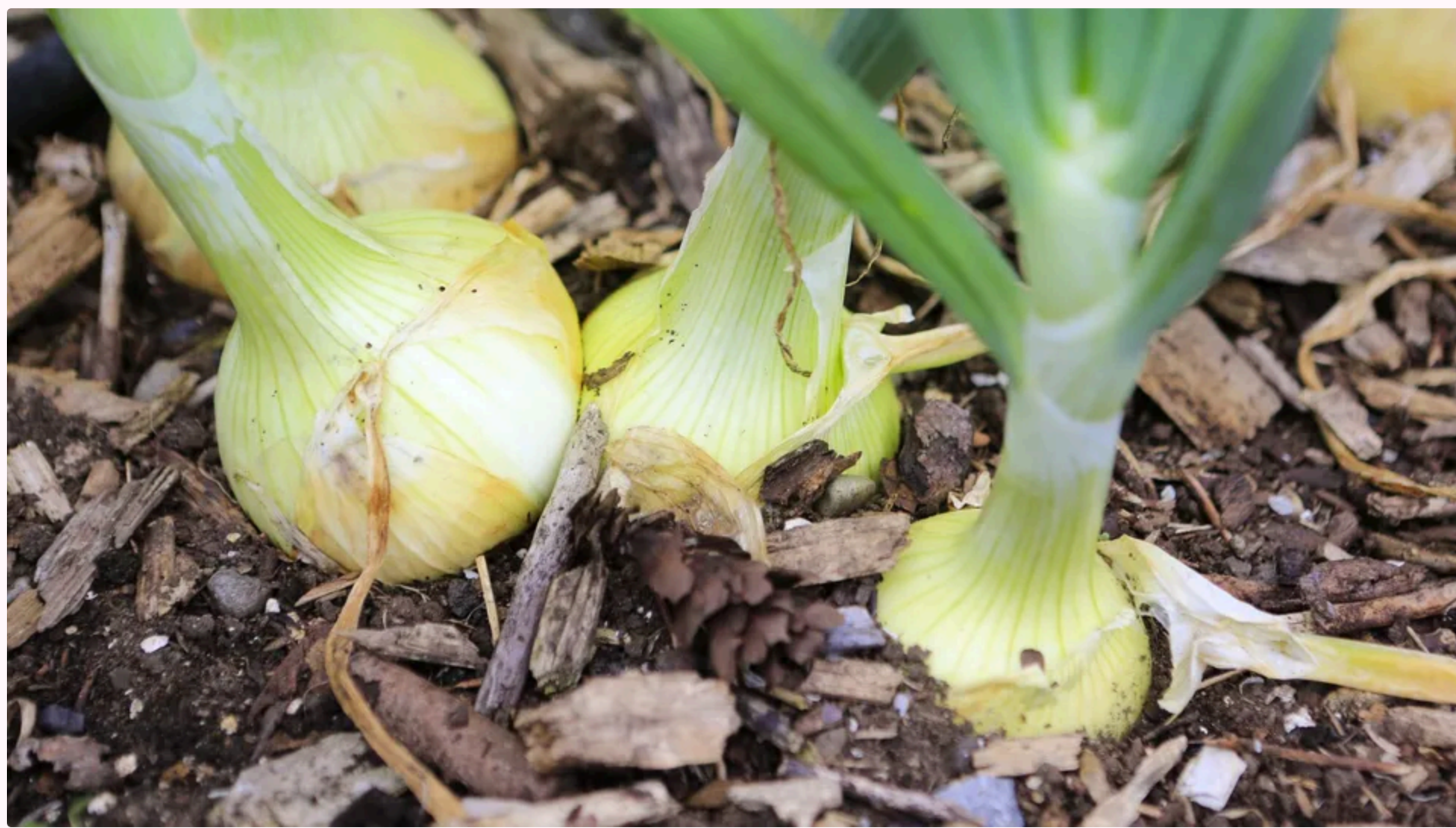
Цибулю варто підживити розчином із попелу.

5 червня, 17:32 [icon] Цей матеріал також можна прочитати на руском