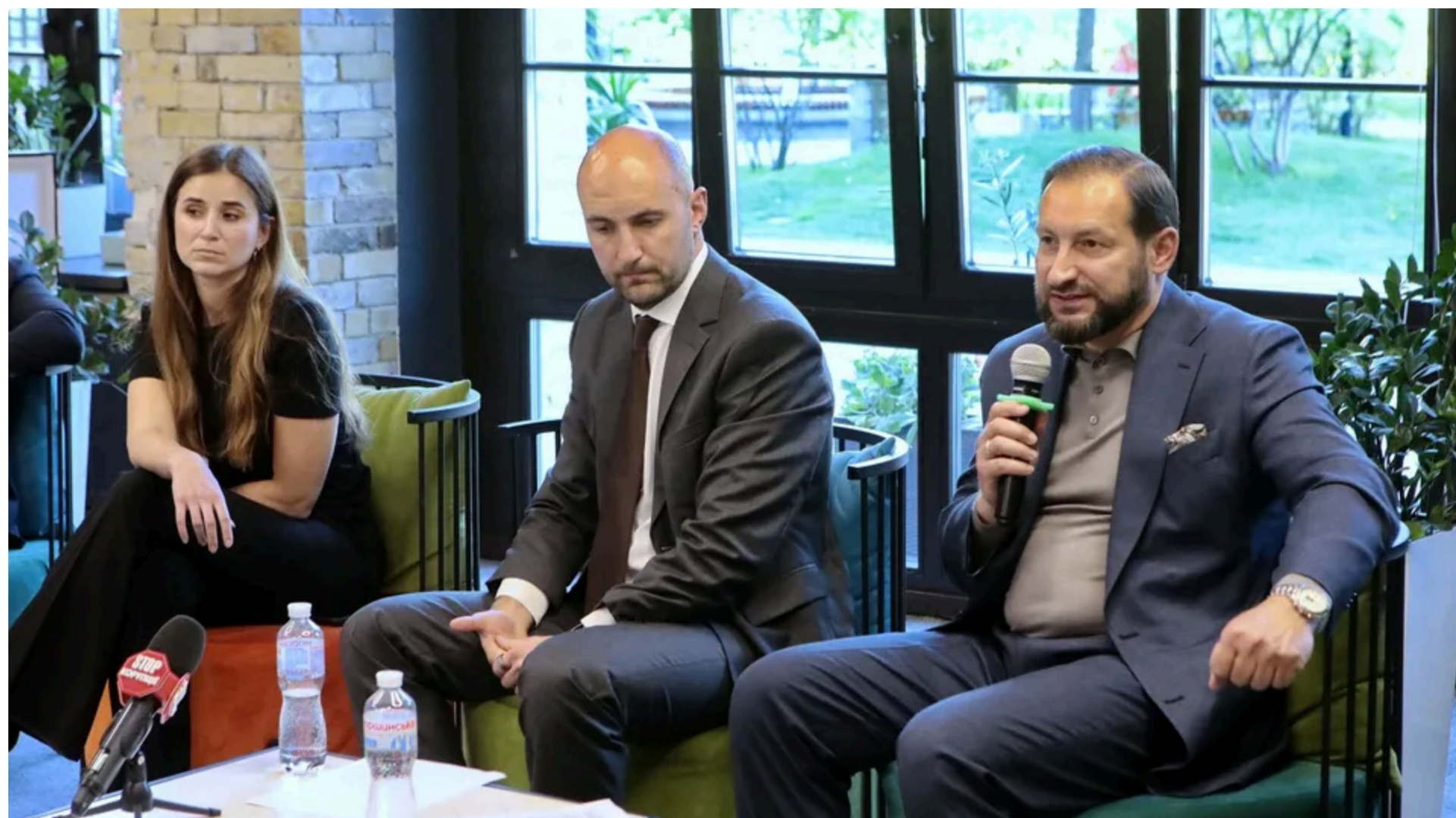
Проблеми енергоринку накопичуються через чинну практику публічних закупівель

16 травня, 17:02 🗨️ Цей матеріал також можна прочитати на русском