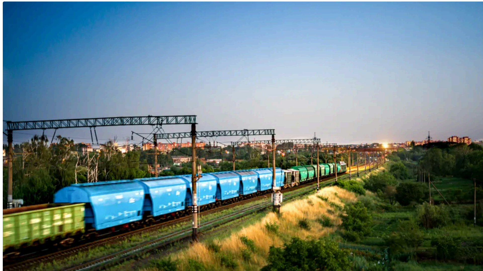
Учасники промислових об'єднань виступили за оцінку вантажних вагонів залежно від фактичного стану

21 травня, 16.03 📷 Этот материал также можно прочитать на русском