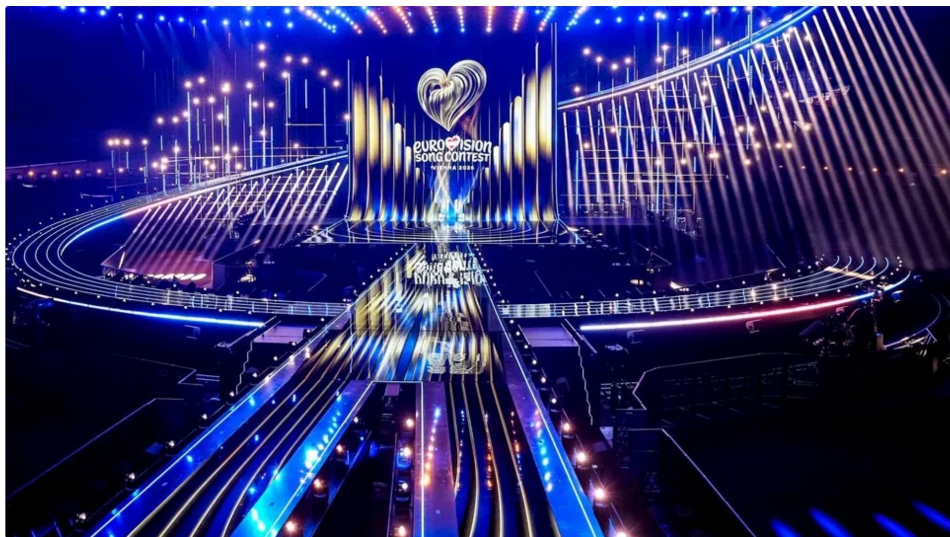
Leleka вийде на сцену "Євробачення 2026" під 12-м номером

14 травня, 09:56 🗣️ Цей матеріал також можна прочитати на руском