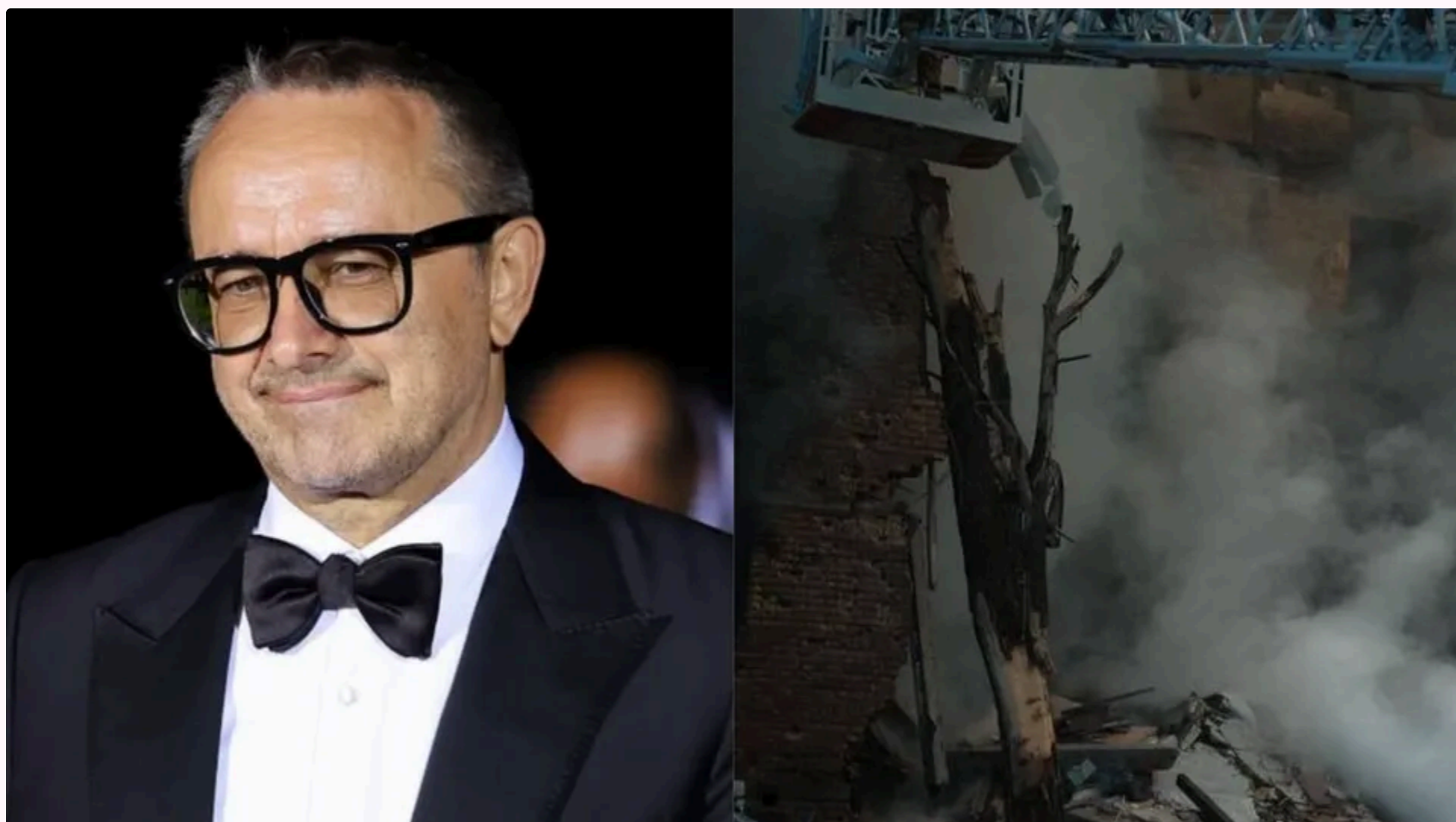
Звягінцев у Каннах закликав Путіна "припинити цю м'ясорубку"

24 травня, 12:50 🗣️ Этот материал также можно прочитать на русском