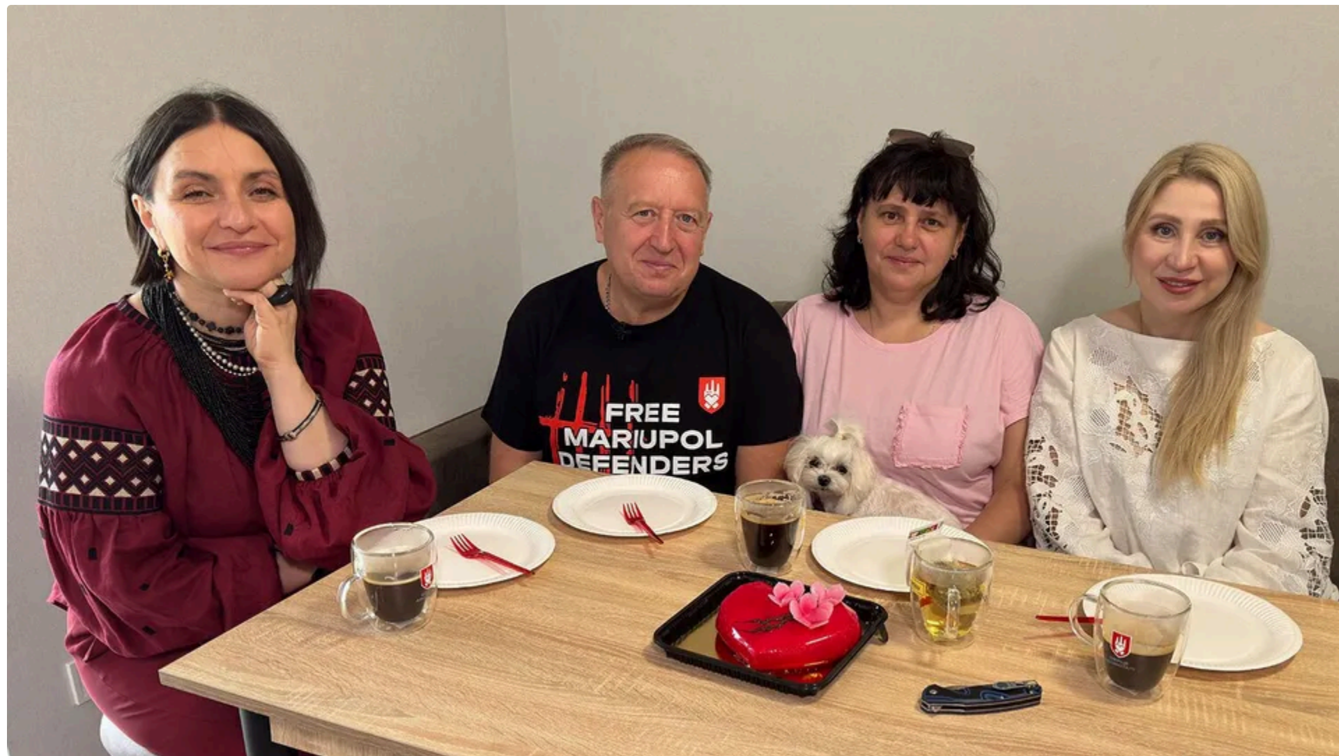
Фонд Ріната Ахметова проводить програму із забезпечення житлом захисників Маріуполя

4 червня, 13.46 🗨️ Этот материал также можно прочитать на русском