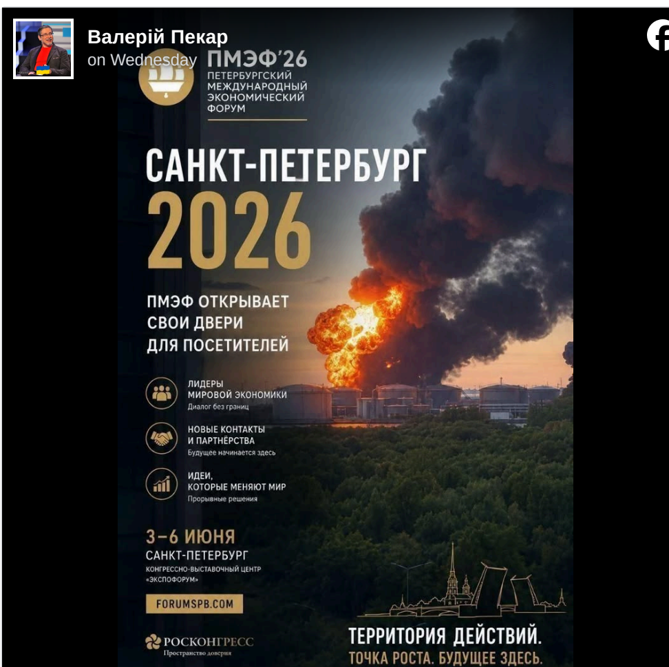
Натисніть, щоб побачити зображення повністю, бо там є важливі навіски.

Утім, "велика промова" якщо й пролунає, то з максимальною дозою бункера, тобто павільйону, інтригою залучається – чи відвадять знову дрони Пітер цього дня, чи Зеленський видасть указ , яким, так тому й бути, дозволить Путіну спокійно виступити на форумі.