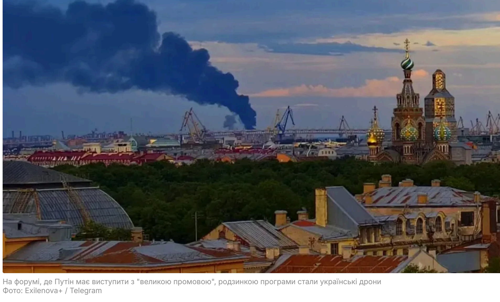
На форумі, де Путін має виступити з "великою промовою", родиною програми стали українські дрони

3 червня, 22:03 Етот материал также можно прочитать на русском