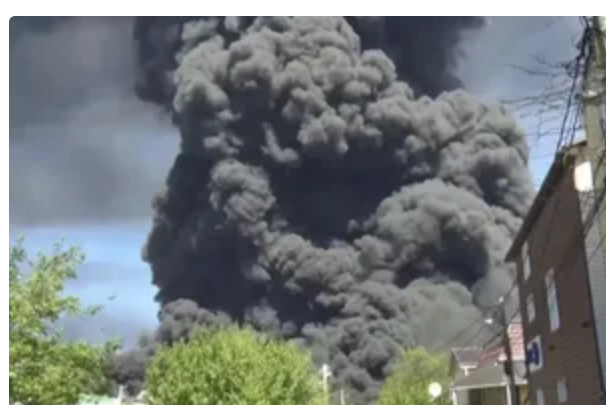
Дефіцит пального у РФ. Обмеження на бензин дісталися Нової Москви – ЗМІ 1 червня, 12:14 СВІТ