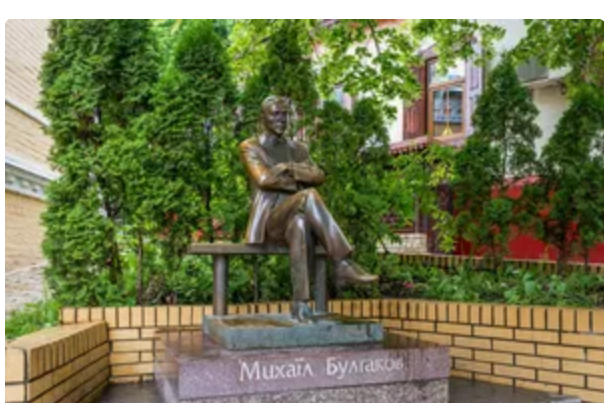
Корогодському соромно, військовим байдуже. У мережі вірує "срач" через Булгакова 6 червня, 13:16 КУЛЬТУРА