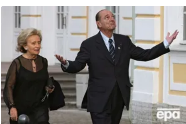
Померла вдова експрезидента Франції Ширака, яка змінила "так багато життів своєю розсудливістю" 6 червня, 13:53 СВІТ