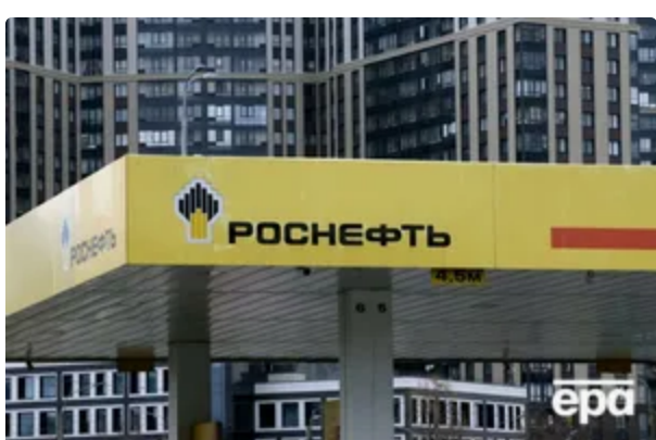
Услід за Кримом у кількох областях РФ обмежили продаж бензину в каністри 2 червня, 21:32 СВІТ