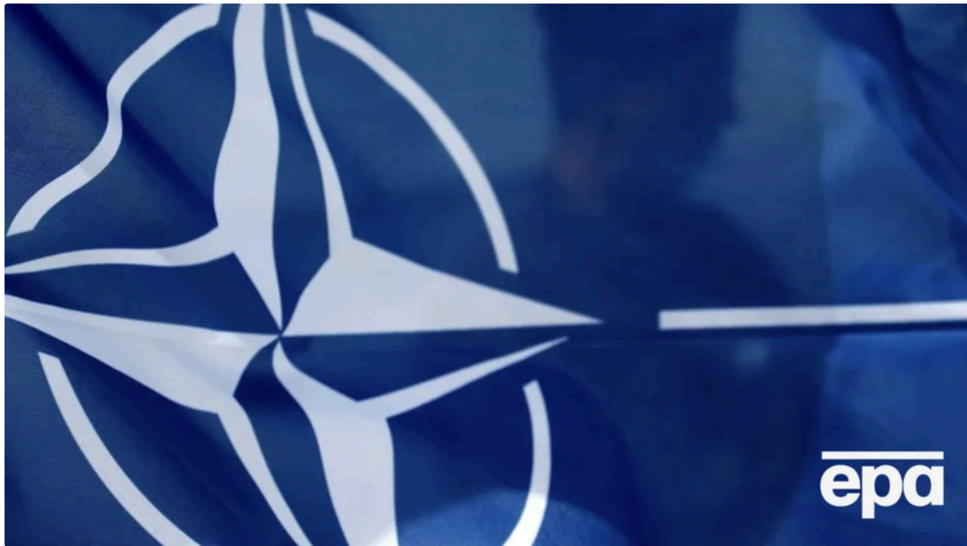
Роос зазначив, що загрози змінилися через розвиток гібридної війни

5 червня, 18.11 🗨️ Этот материал также можно прочитать на русском