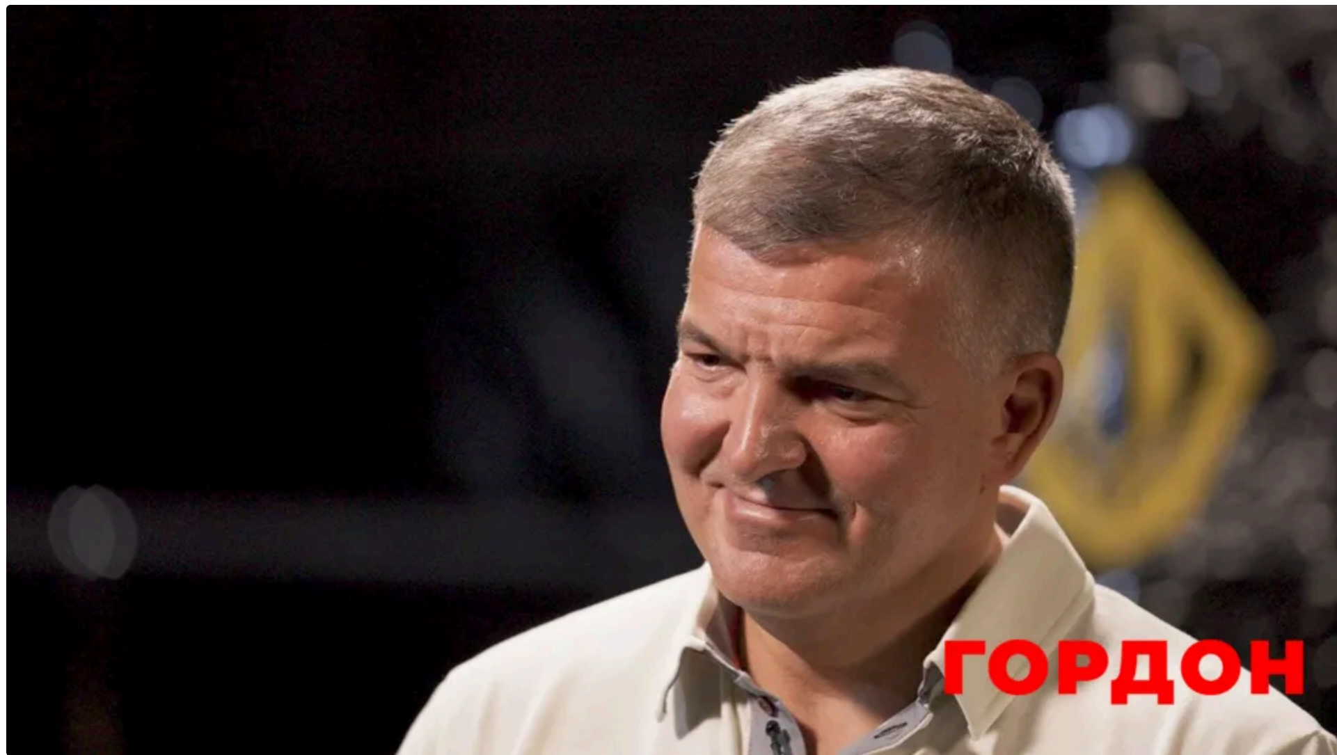
За словами Штілермана, Росія може готувати "різні провокації", щоб "урятувати" себе

4 червня, 19.56 🗨️ Цей матеріал також можна прочитати на руському