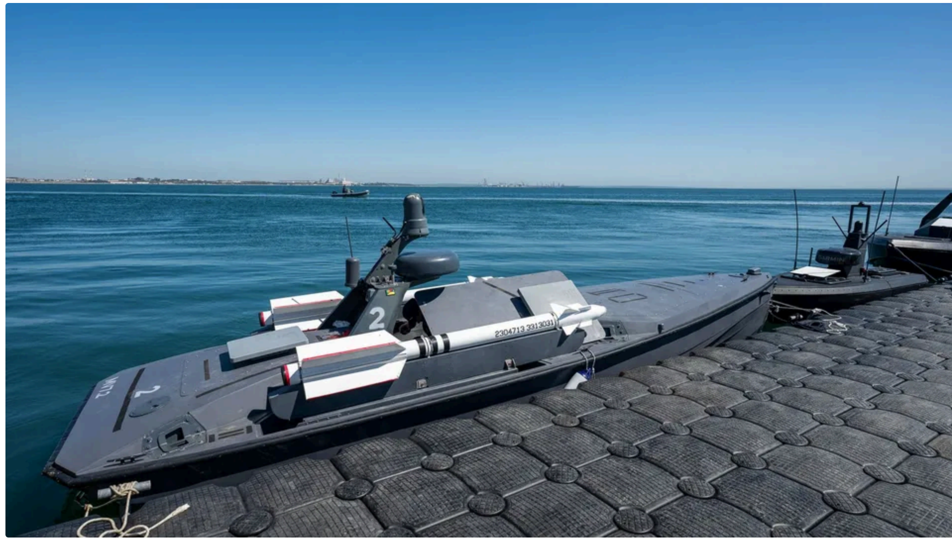
Безекипажний катер втратив керування через дію засобів РЕБ росіян ( іностративне)

5 червня, 15.44 Цей матеріал також можна прочитати на руском