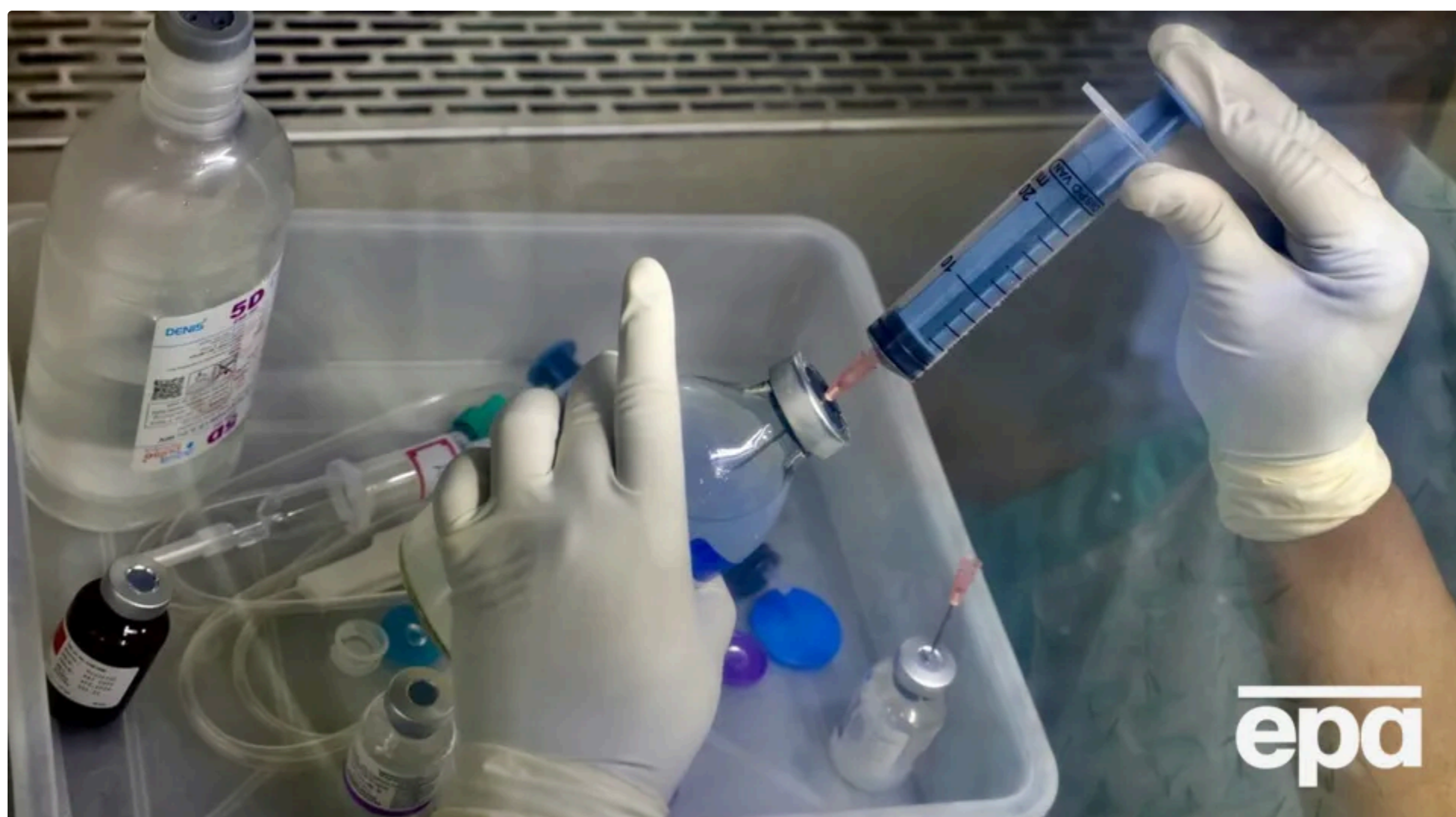
Половина пацієнтів із раком підшлункової залози помирає протягом трьох місяців

4 червня, 16.55 📢 Этот материал также можно прочитать на русском