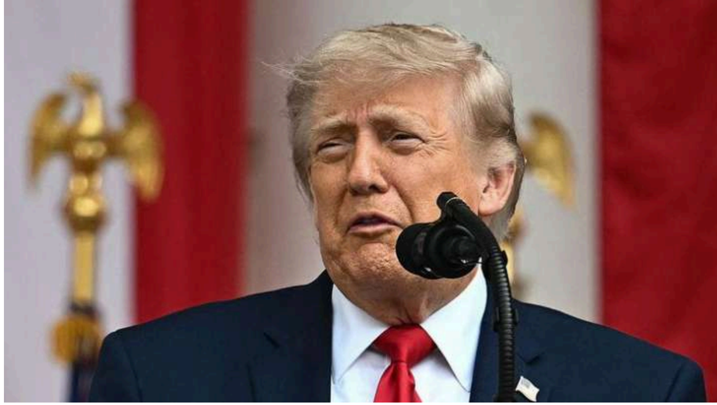
Дональд Трамп

Президент США Дональд Трамп сталкивается со значительным падением уровня поддержки внутри страны и, по оценкам обозревателей, не демонстрирует эффективности урегулирования международных конфликтов, в частности войны с Ираном. В то же время, на его политическое будущее может повлиять ситуация вокруг войны в Украине.