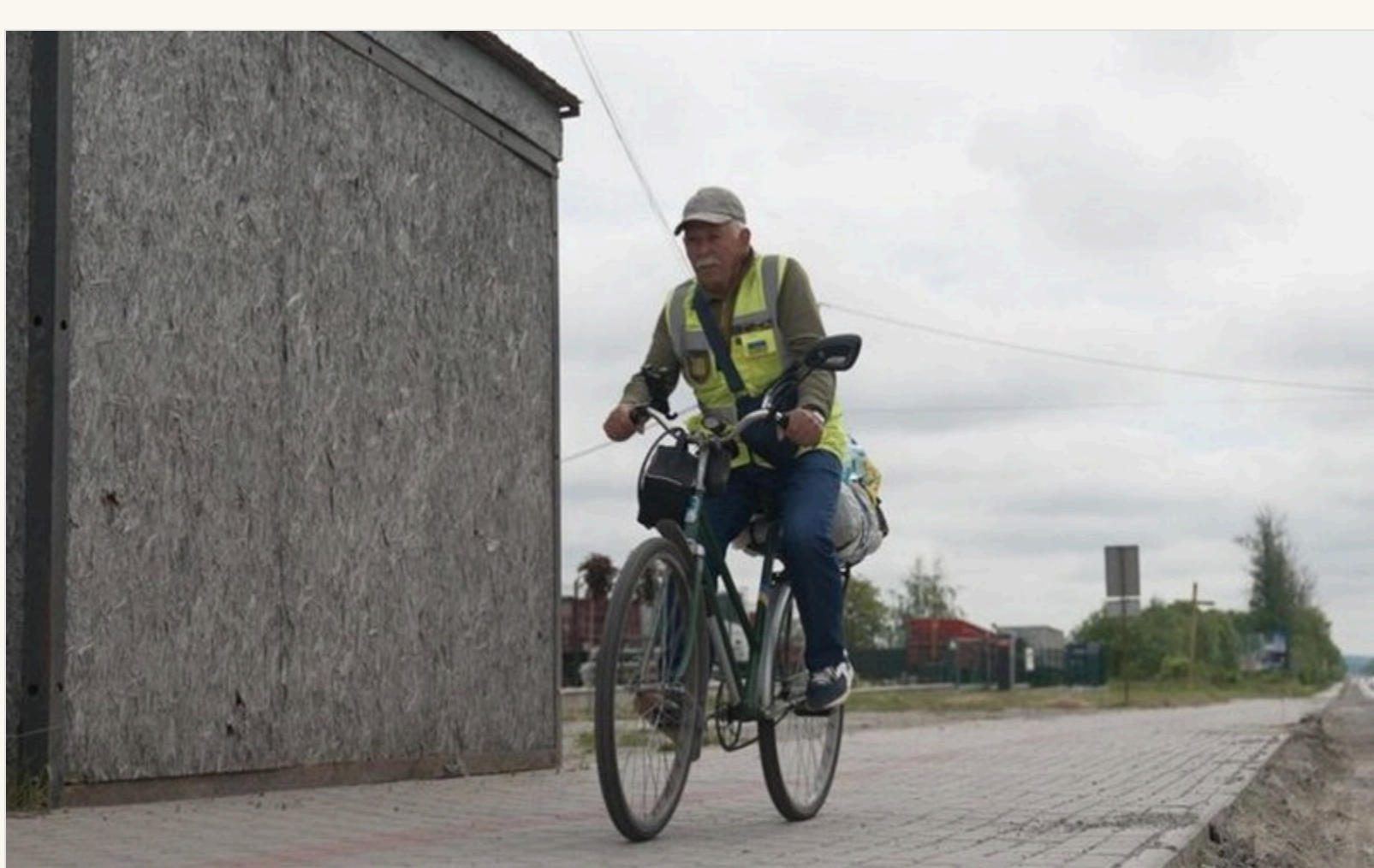
Цього разу волонтер влаштував веломарафон з рідної Опішні до Чопа

«Ніяк не готувався, адже перед тим багато працював на городі — садив бульбу, сіяв насіння, косив, — розповідає волонтер. — Але крутити педали значно важче. Перші 50 кілометрів проїхав і трохи перепочив у лісі біля Сорочинців.