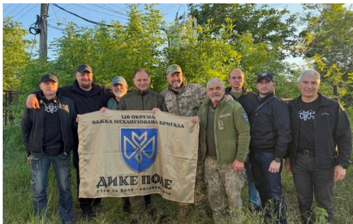
Фото: Олег Тягнибок (у центрі) разом із військовослужбовцями 128-ї окремої важкої механізованої бригади "Дике Поле" (t.me/martsinkiv_ONLINE)