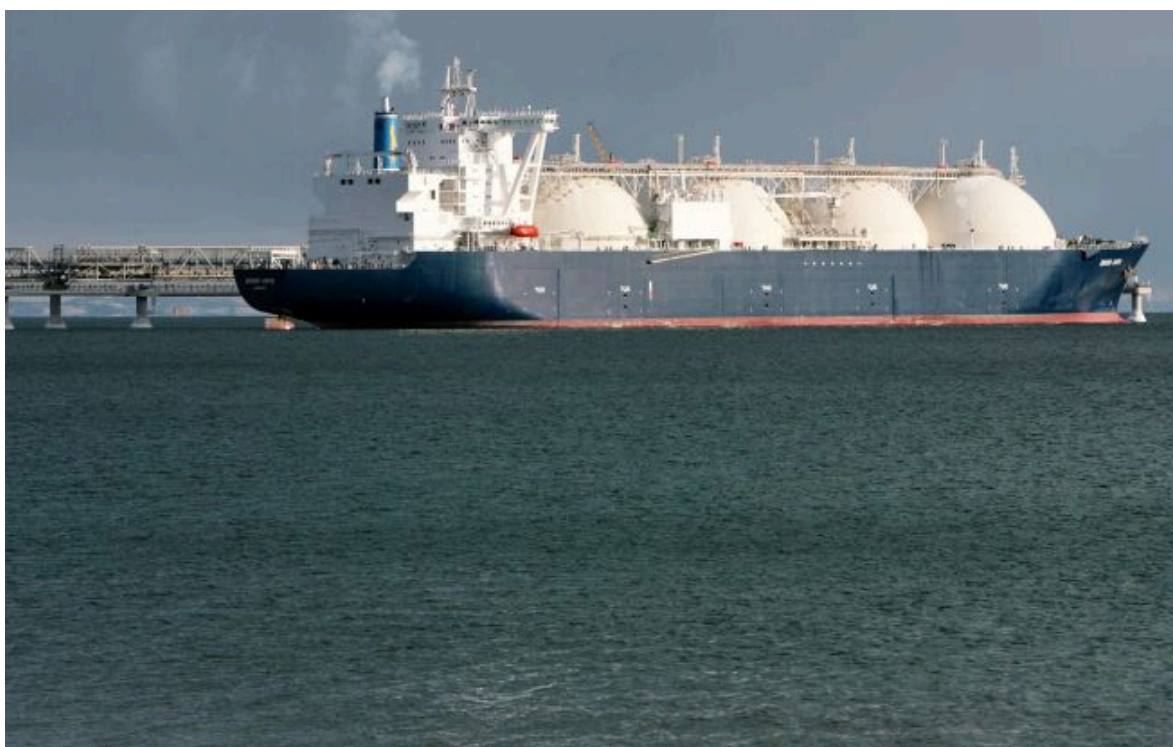
Фото: танкер для транспортування скрапленого природного газу