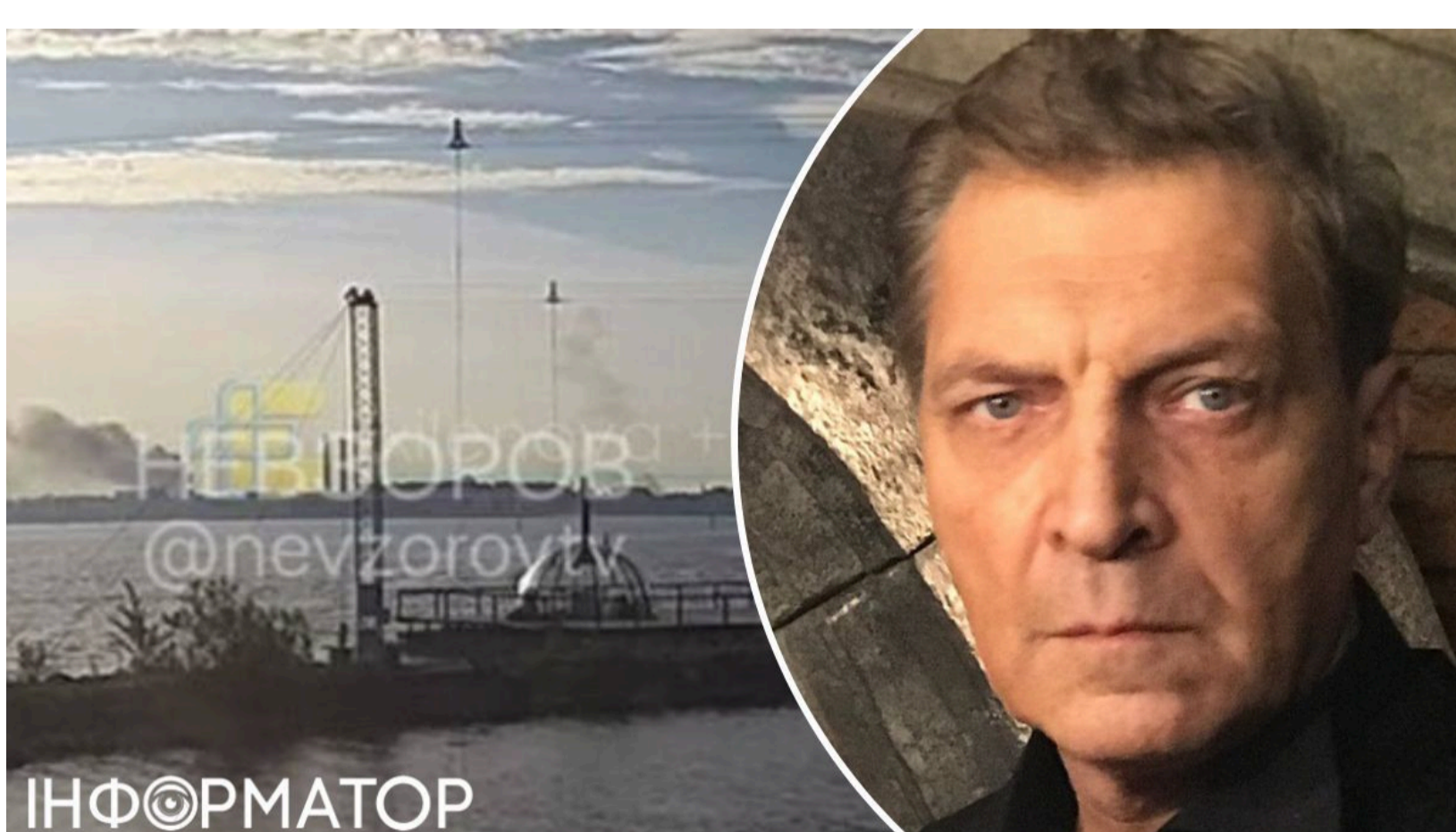
Удари по Балтійському флоту РФ – джерела Невзорова

У Ленінградській області РФ 6 червня стались детонації на складах військової частини №81263 - 7082-ї технічної мінно-торпедної бази ВМФ РФ у Великій Іжорі. Росія вже зазнає глибоких економічних потрясінь через війну - і тепер до них можуть додатись катастрофічні втрати флоту. Відомий петербурзький публіцист Олександр Невзоров стверджує, що у Леб'язьому вражений склад 15-го арсеналу ВМФ Росії - бази забезпечення Балтійського флоту. При цьому не можна виключати дезінформацію, тож очікуємо офіційних підтверджень з українського боку.