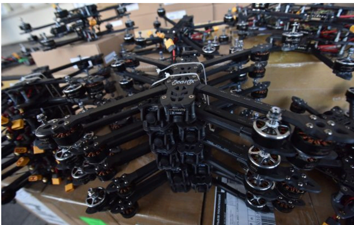
Фото: виробництво дронів (Getty Images)