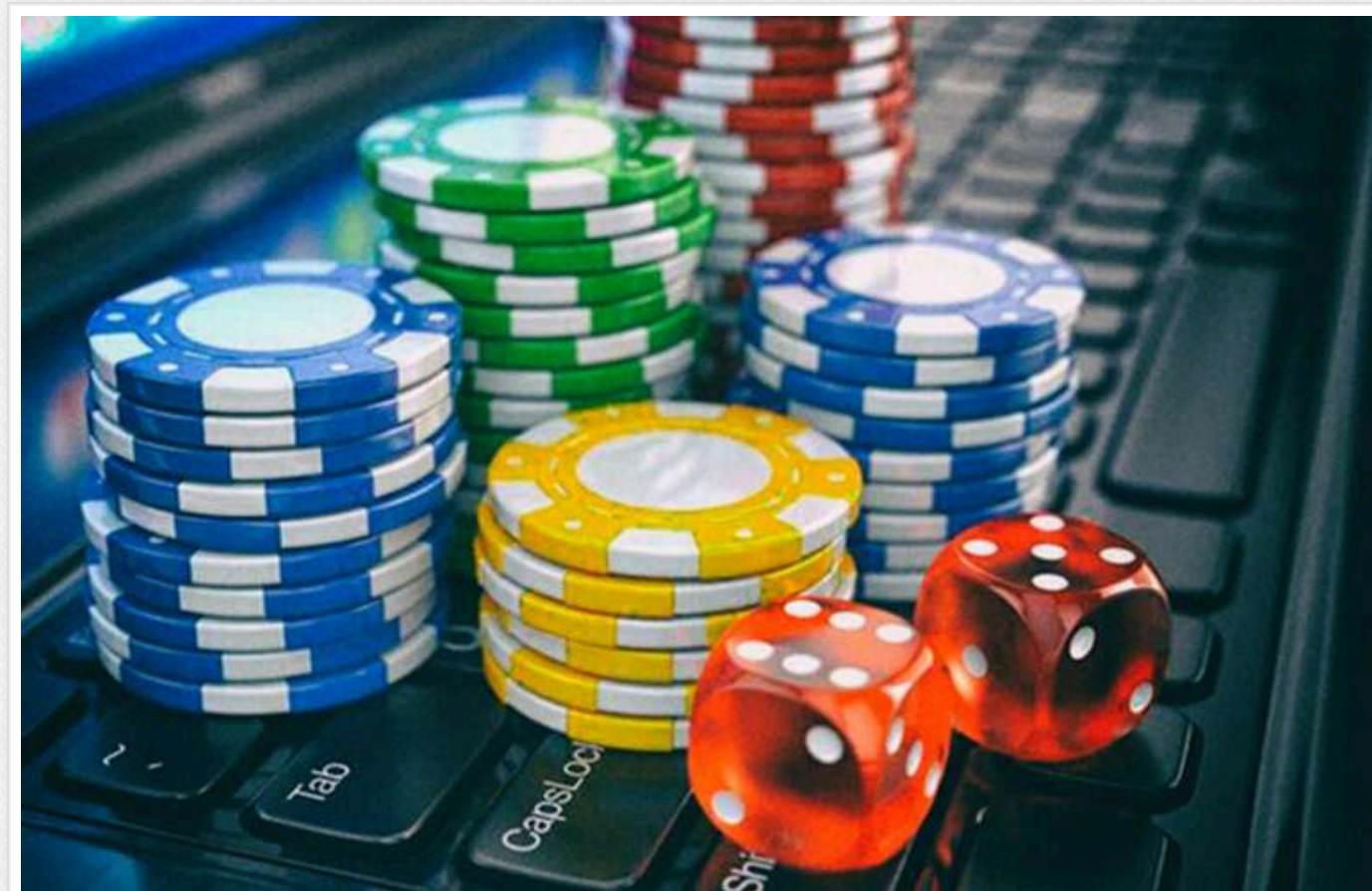
Збитковий гемблінг: VBET, Cosmolot і Slots City показали мільйонні збитки, попри мільярдні доходи