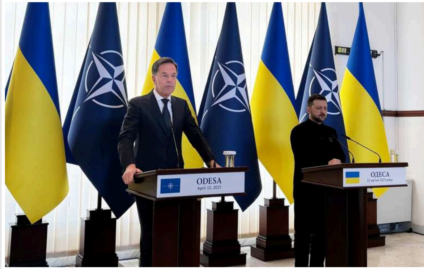
Генсек НАТО Марк Рютте відвідав Одесу і зустрівся із Зеленським

Генеральний секретар Північноатлантичного альянсу та колишній прем'єр-міністр Нідерландів Марк Рютте 15 квітня прибув до Одеси, де зустрівся з президентом Володимиром Зеленським.