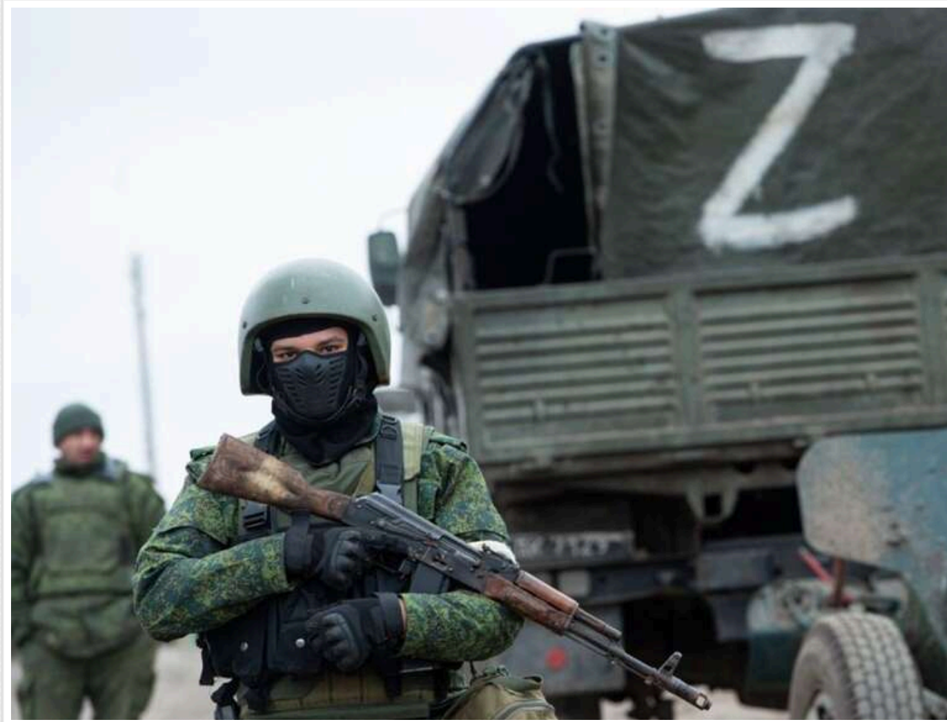
Окупанти на Лиманському напрямку «затиснули» Нове: тривають бої за Новомихайлівку

На Лиманському напрямку російські окупанти досягли успіху в районі села Нове Краматорського району. Вони затиснули населений пункт з обох боків та взяли під контроль усі дороги.