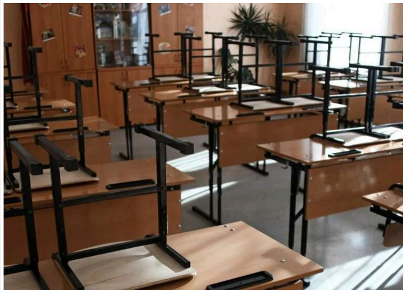
ЦПД спростував фейк про скорочення літніх канікул: школи самі вирішують тривалість літніх канікул, але не менше 30 днів

Кожен навчальний заклад самостійно визначає тривалість канікул, які, однак, не повинні бути меншими за 30 календарних днів.