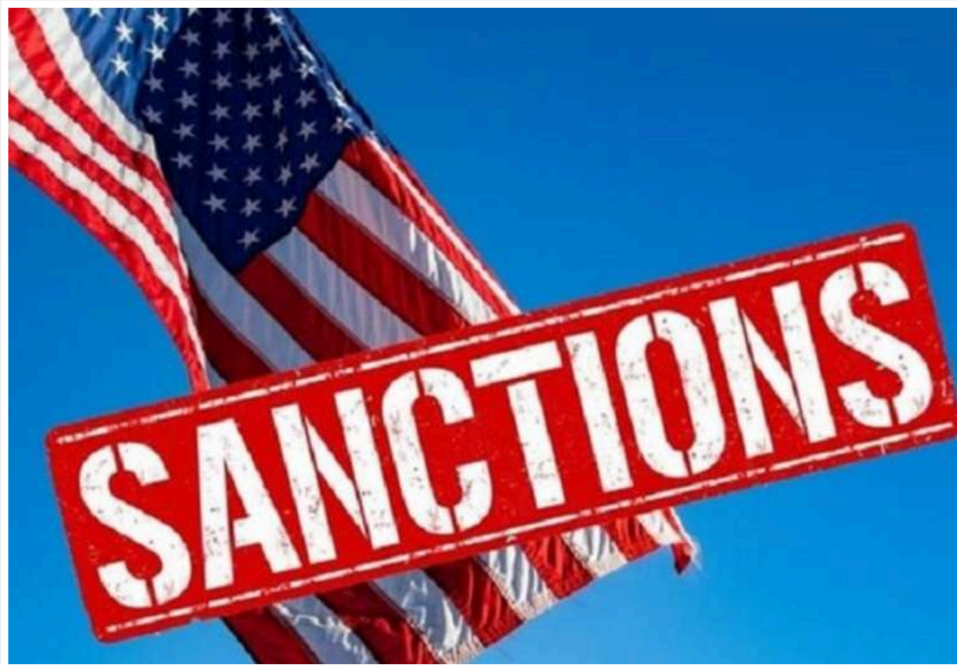
США готують нові санкції проти РФ на випадок зміни позиції Трампа - WSJ

Державний департамент і Міністерство фінансів США розробляють варіанти посилення санкцій проти Росії, повідомляє The Wall Street Journal з посиланням на колишнього високопосадовця Держдепу Деніела Фріда.