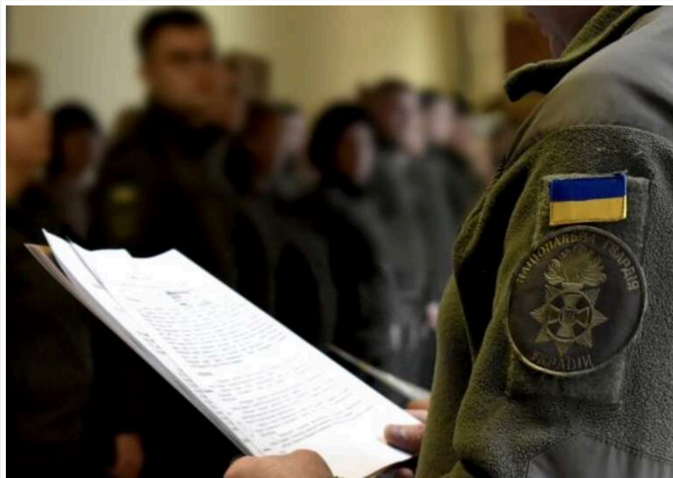
Два нові корпуси в Нацгвардії очолять командири «Азова» і «Хартії»

Національна гвардія України створила два нових корпуси в рамках свого реформування. Їх очолять полковники «Азову» та «Хартії».