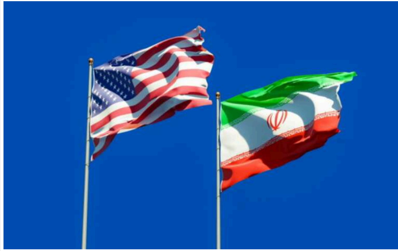
Іран відкинув вимоги США щодо ядерної програми та висунув власні умови для переговорів

Тегеран відхилив вимоги Вашингтона щодо ядерної програми під час недавнього візиту спеціального посланника США Стіва Віткоффа до Ірану. Водночас висунув власну умову.