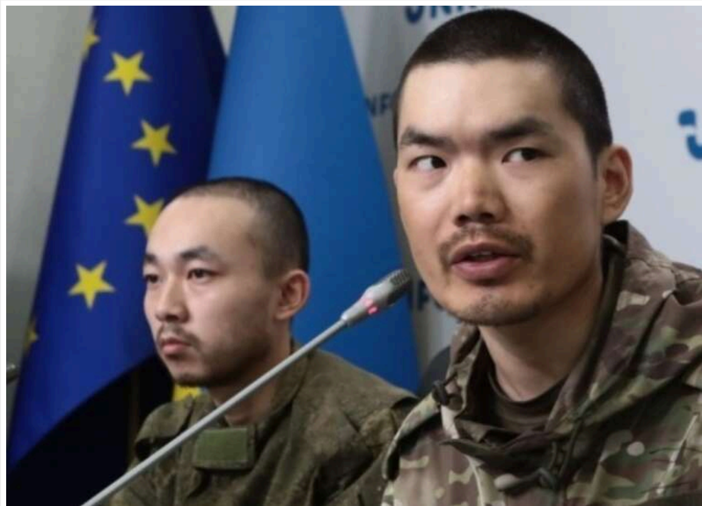
Китай повідомив, що згідно із законодавством оцінюватиме поведінку своїх громадян, які потрапили в полон в Україні

Китайський уряд заперечує свою причетність до участі громадян КНР у війні між Росією та Україною і обіцяє після перевірки всіх обставин оцінити дії своїх громадян, захоплених у полон у Донецькій області, згідно з національним законодавством.