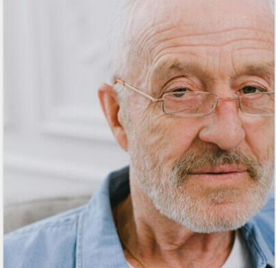
Українці зможуть піти на пенсію лише за цієї умови: мають ..