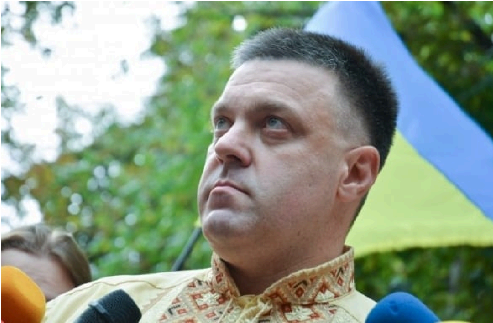
Олег Тягнибок