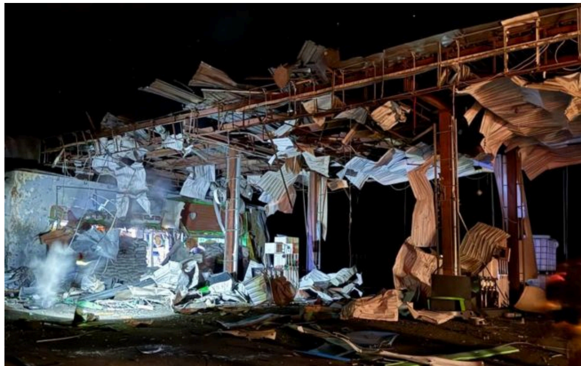
Фото: росіяни вдарили по енергетиці, АЗС та поштовому авто на Сумщині