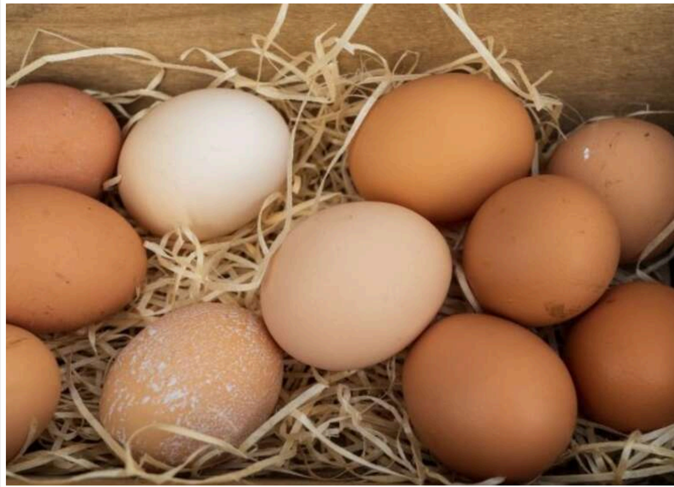
Ціни на курячі яйця почали знижуватися: десяток подешевшав на 5,2%

Після різкого підвищення восени 2024-го та рекордних цін на початку року, ціни на курячі яйця нарешті почали зменшуватися. Це перше відчутне зниження з лютого.