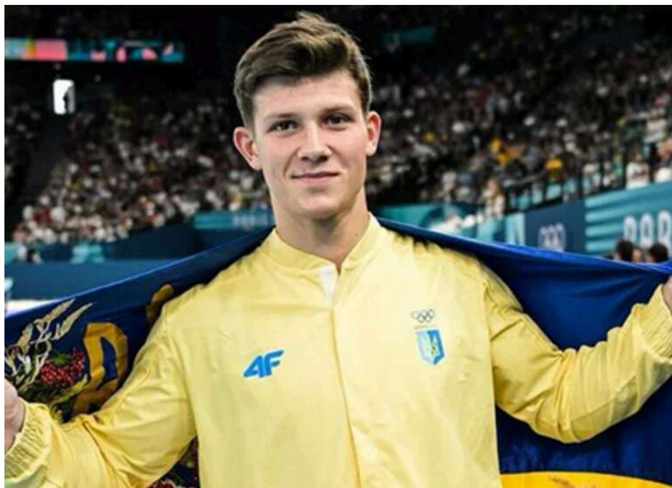
Спортсмен Ілля Ковтун засвідчив, що подав документи для зміни громадянства та прагне виступати за національну команду Хорватії

Срібний призер Олімпійських ігор зі спортивної гімнастики Ілля Ковтун вперше прокоментував своє рішення виступати під прапором Хорватії.