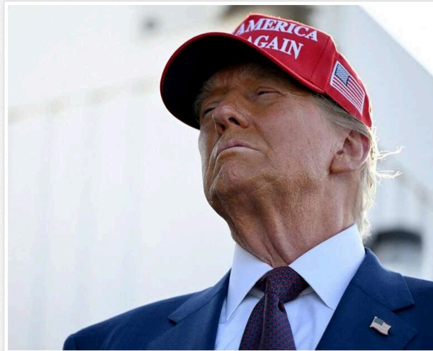
Найкраще визначення інтелекту — здатність передбачати майбутнє, — Трамп

47-й президент США Дональд Трамп зробив нову заяву у своїй соціальній мережі X, зазначивши, що «найкраще визначення інтелекту — це здатність передбачати майбутнє».