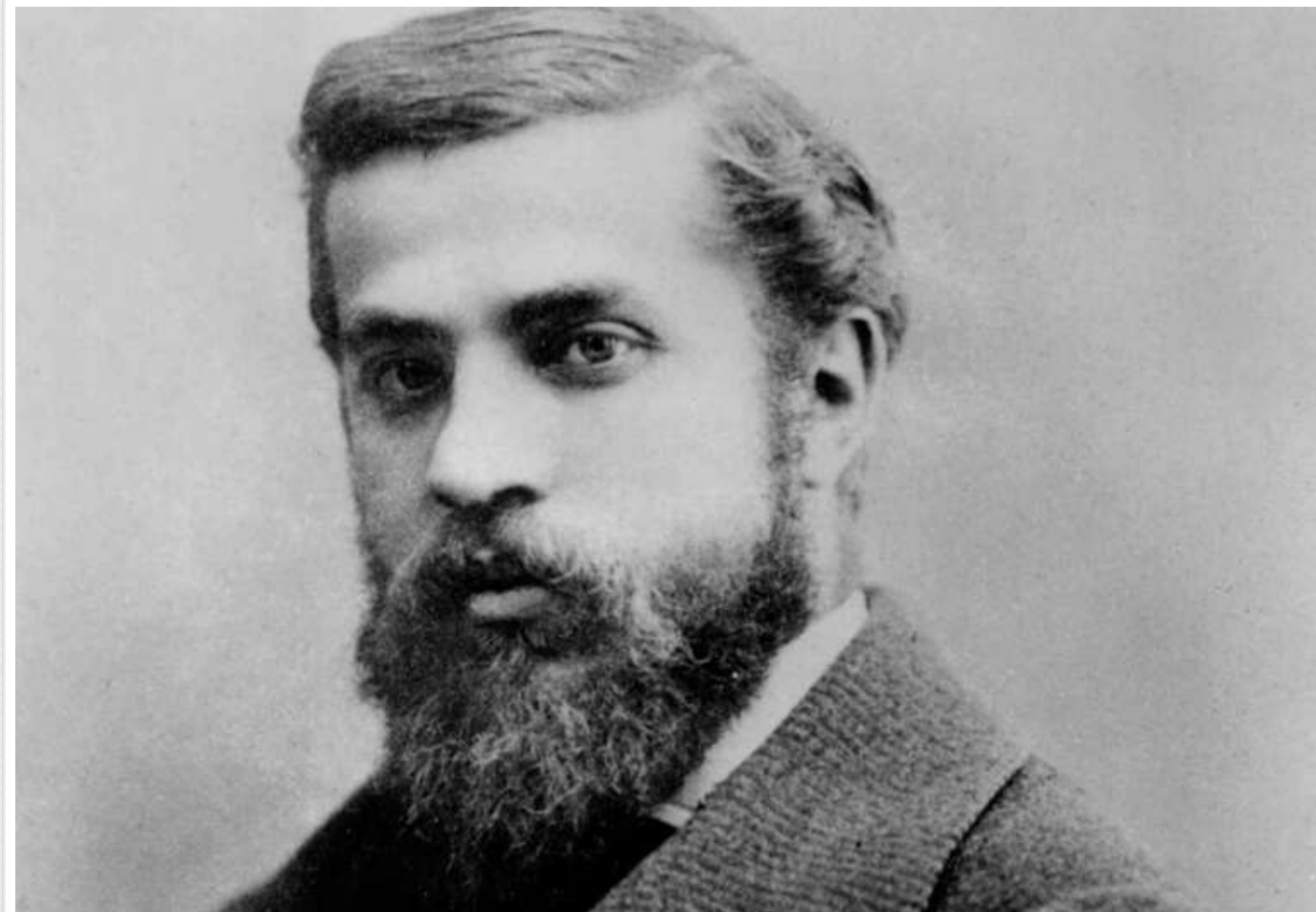
Антоніо Гауді наблизився до визнання святим — Ватикан визнав його «звитяжні чесноти»

Ватикан офіційно визнав «героїчні чесноти» знаменитого іспанського архітектора Антоніо Гауді, що є першим кроком на шляху до його беатифікації.