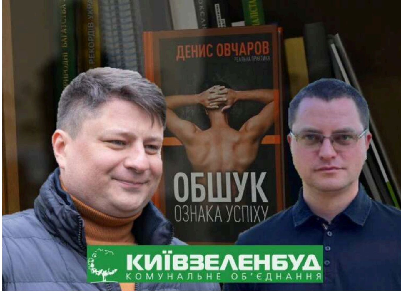
Керівництво "Київзеленбуду" підозрюють у корупційній схемі на 25 мільйонів гривень. ДБР розслідує "відкати" за підядри

ДБР продовжує розслідування у справі можливого отримання "відкатів" керівництвом КО "Київзеленбуду". Наразі правоохоронцями попередньо встановлено 5 фактів надання такої непровірної вигоди на загальну суму 3,47 млн гривень від двох компаній і одного ФОП. Завалом, за даними прокуратури, посадовці комунального об'єднання планували заробити близько 25 млн гривень.