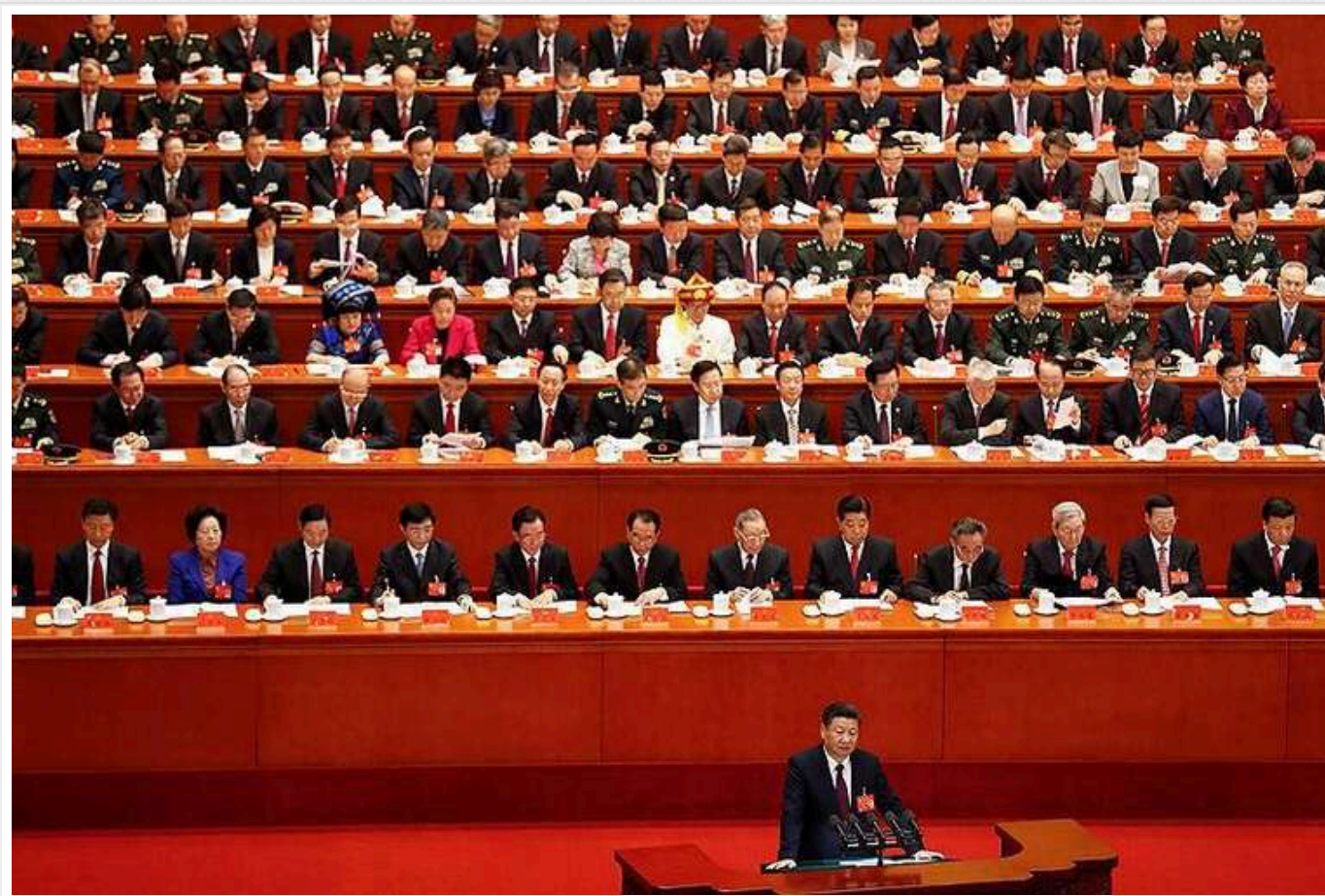
Китай вводить режим «військової операції» для чиновників у відповідь на мита США, - Reuters

У відповідь на підвищення мит із боку США Китай активував режим «військової операції» для своїх чиновників. У міністерствах комерції та закордонних справ країни скасовані відпустки, а спіробітникам наказано бути на зв'язку цілодобово, повідомляє Reuters.