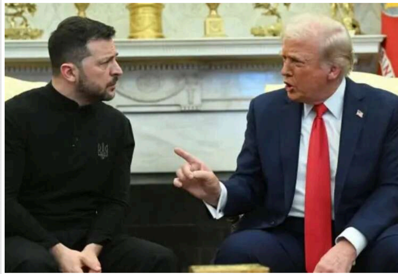
Білий дім планував запровадити санкції щодо оточення Зеленського, - нардеп