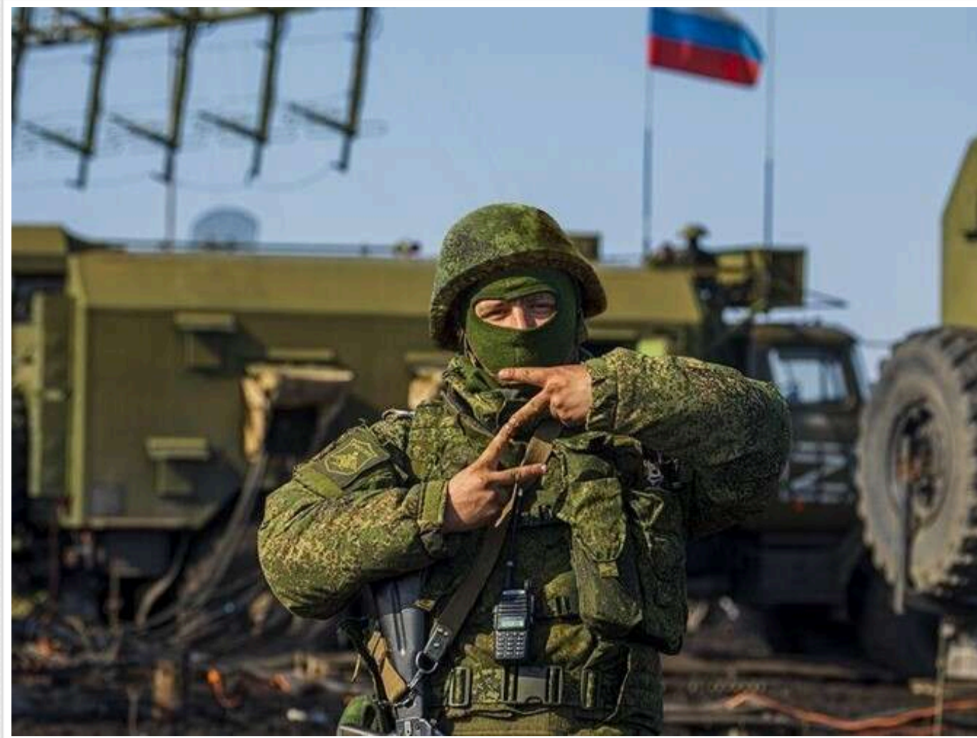
Росіяни масово йдуть в армію, розраховуючи на швидке завершення війни: мотивовані «високими бонусами»

Росіяни почали активніше записуватися на війну в Україні, очікуючи її швидкого закінчення, стверджує заступник голови відділу Східної Європи та Євразії Німецького інституту міжнародних та зовнішньополітичних справ Яніс Клюге.