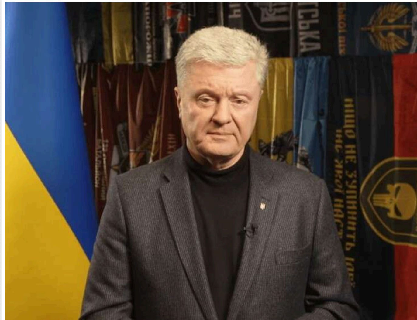
Порошенко в інтерв'ю The New York Times: для успішних мирних переговорів потрібен уряд національної єдності

The New York Times вирішила присвятити статтю колишньому президенту Петрові Порошенку, який в інтерв'ю виданню заявив, що мирні переговори з РФ можуть пройти більш гладко, якщо в уряд увійдуть представники опозиції.